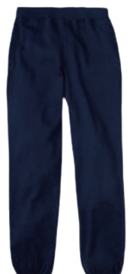
ディープネイビー (174)